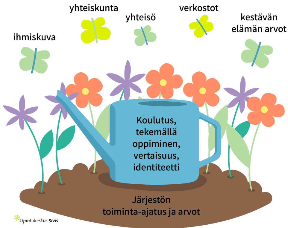
Kuva: Järjestöllinen sivistys kuvana. Teoksesta Fields, M. (toim.). (2021) Järjestöissä me innostutaan. Oppiminen ja kestävä sivistys järjestötoiminnassa.

Kuinka järjestöt voisivat tunnistaa roolinsa yhteiskuntaa ja yhteisöjä uudistavina toimijoina? Voisiko järjestöjen tuottama uudistava oppiminen edistää ajankohtaisia tärkeitä teemoja, esimerkiksi kestävästä oppimisesta tai kestävästä sivistystä? Järjestöissä oppiminen ja sivistyminen voi tapahtua laaja-alaisesti verkostoissa, yhteisöissä sekä vallalla olevien ihmiskuvien avulla. Kuinka tämä oppiminen eroaa formaalista oppimisesta?